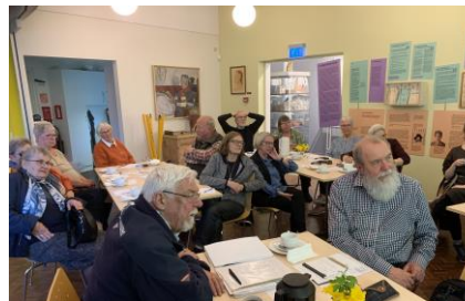
Fra dialogmødet i Farsø

Det er givende for bestyrelsens arbejde, at vi løbende møder nuværende og potentielt kommende medlemmer af SAMMUS – og gennem dialog kan informere om arbejdet i SAMMUS, men også at få inspiration til, hvordan SAMMUS kan være med til at understøtte vore medlemmers arbejde – både gennem aktiviteter igangsat af SAMMUS, men også ved at skabe et forum, hvor deltageres mange erfaringer kan give viden og inspiration til det vigtige arbejde, der sker i de enkelte foreninger.